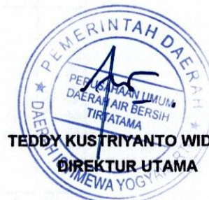
TEDDY KUSTRIYANTO WIDODO DIREKTUR UTAMA