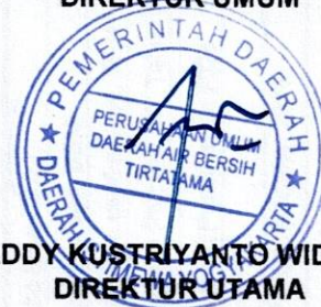
TEDDY KUSTRIYANTO WIDODO DIREKTUR UTAMA